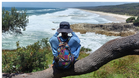
North Stradbroke Island

久しぶりに、留学生向けに開かれるツアーへ参加しました。この島は、世界で2番目に大きいと言われている砂の島です。フェリーで30分ほどかけて、島に着きました。野生のカンガルーを見ることができました。