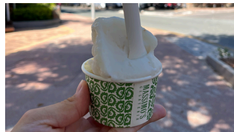
美味しかったジェラート

観光地として良く知られている、Sunshie CoastのNoosaへ行ってきました。景色を眺めながら、10kmウォーキングをしました。とても素敵な場所で、1日では足りなかったです。またいつか訪れたいです。