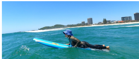
サーフィンをする私

あけましておめでとうございます。今年もよろしくお願いします。 年が明け、最後のTermに入りました。最近、オーストラリアでの生活も残り1ヶ月を切り、あと何回海に入れるかな、あと何回How's going?と聞けるかな、と寂しさを覚えると同時に、日本へ帰るのも楽しみになってきました。